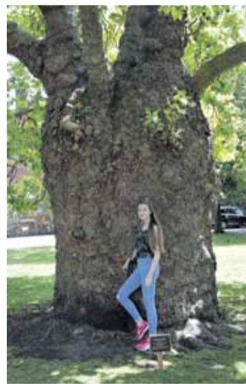
Ātraudzīgā kļava Kenterberijas katedrāles parkā iestādīta tikai 1820. gadā un jau sasniegusi tādus apmērus.

Ja reiz esi Ramsgeitā, tad grēks neapskatīt UNESCO mantojuma objektu Kenterberiju, kas atrodas vien ap 20 jūdžu no apmešanās vietas. Precīzu attālumu nav viegli pateikt, jo Ziemeļjūras piekrastē pilsēta ir pie pilsētas, ir nemanīsi, ka no vienas jau būsi ierāucis citā, jo tās tikpat kā nešķir neapdzīvoti