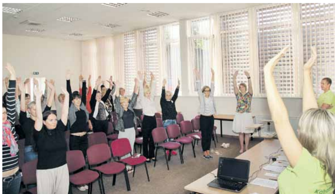
Valsts ieņēmumu dienesta Kuldīgas klientu apkalpošanas centra darbinieces izmēģina līdzsvara vingrinājumus.