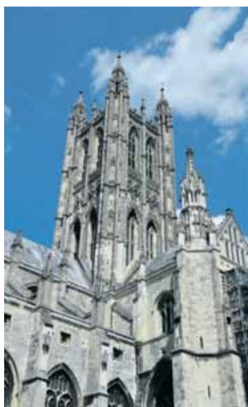
Grūti iedomāties vēl varenāku anglikāņu baznīcu par gotisko Kenterberijas katedrāli Anglijā.