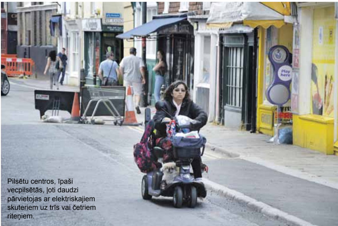
Pilsētu centros, īpaši vecpilsētās, ļoti daudzi pārvietojas ar elektriskajiem skuteriem uz trīs vai četriem riteņiem.