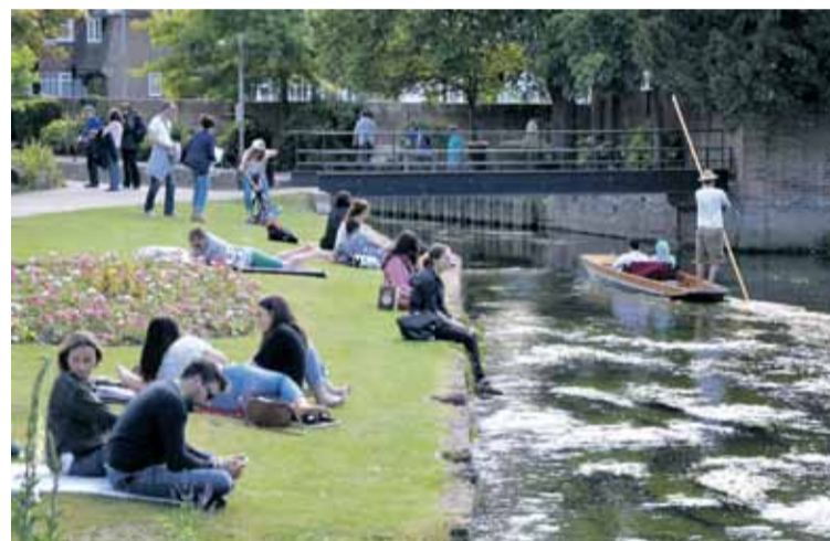
Laivās vizinās tūristi, bet upes krastos zviln jaunieši, un dažiem ir pat grāmatas rokās.