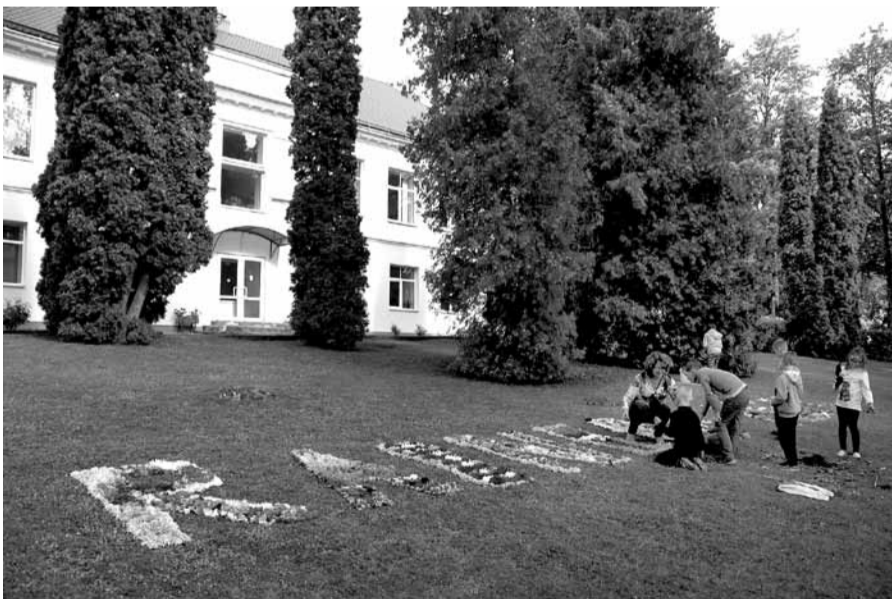
Z.A.Meierovica Kabiles pamatskolā top ziedu paklājs.

Tieši šodien apriņķa 150. gadadiena. Z.A.Meierovica Kabiles pamatskolā to svin ar Dzejas stundu, kas notiek divdesmito gadu.