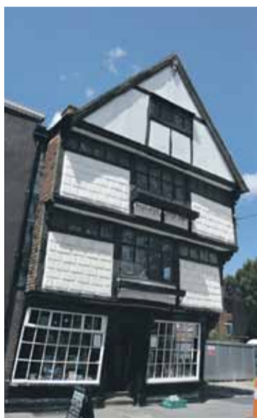
Katrai valstij vismaz vienā pilsētā vajadzīgs kāds Pizas tornis .