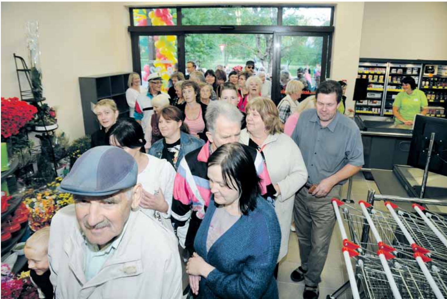
Pirms atvēršanas pie veikala Labais Mucenieku ielā sapulcējies krietns bariņš pircēju, kas, durvīm veroties, steidza iepazīt piedāvājumu.

Ceturtdien 12.00 durvis vēra vēl viens jauns veikals-noliktava Kuldīgā – Labais Mucenieku ielā ir Dundagas uzņēmuma Gabriēla piektais veikals pilsētā.