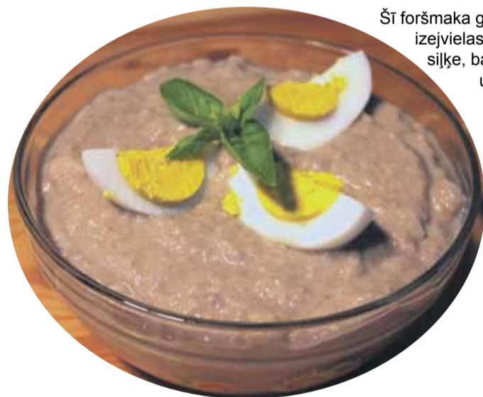
Gatavo pastēti dekorē ar vārītām olām un zaļumiem.

Šajā receptē pamata izejvielas ir siļķe, baltmaize un āboli, tomēr ar piedevām var variēt un pievienot garšaugus, sīpolus, sviestu, vārītas olas un citas sastāvdaļas. Dažās receptēs teikts, ka sālīto siļķi vajag izmērcēt melnajā tējā vai pienā, bet to var mērcēt vai tikai noskalot arī ūdenī.