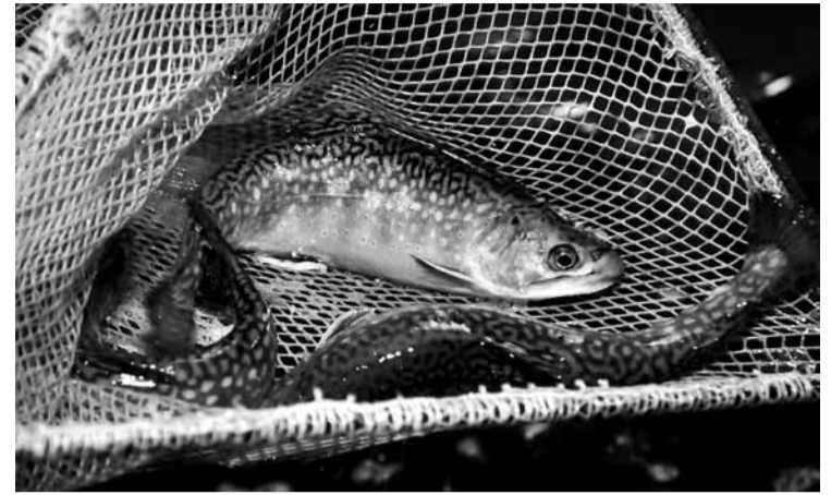
Pallijas ir skaistākas nekā foreles, bet arī prasīgākas.

Tagad te ir sakopta teritorija, bet audzētava ierīkota vietā, kur agrāk bijis mežs. Tās izveide prasījusi ļoti lielus ieguldījumus – ar zemes