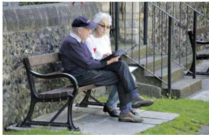
Sapelnījuši naudu, angļu lordi un lēdijas vecumdienās atpūšas.