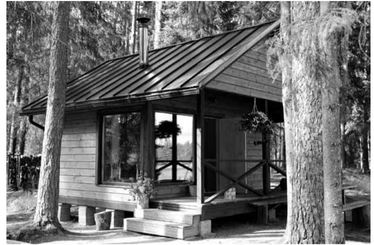
Šajā namiņā var apmesties makšķernieki.

„Jau 2012. gada aprīlī par biedru saziēdoto naudu – 2000 latiem (ap 2846 eiro) – sadarbībā ar Latvijas Zivju resursu aģentūru ezerā ielaidām vēdzeles, kā arī līdakas (mazās, lielās un dažas vaislinie-