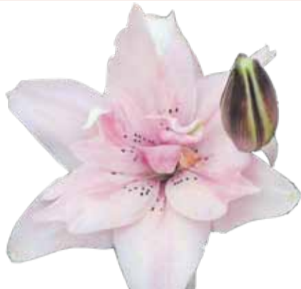
No mammas mantotas lilijas. 5. lpp.