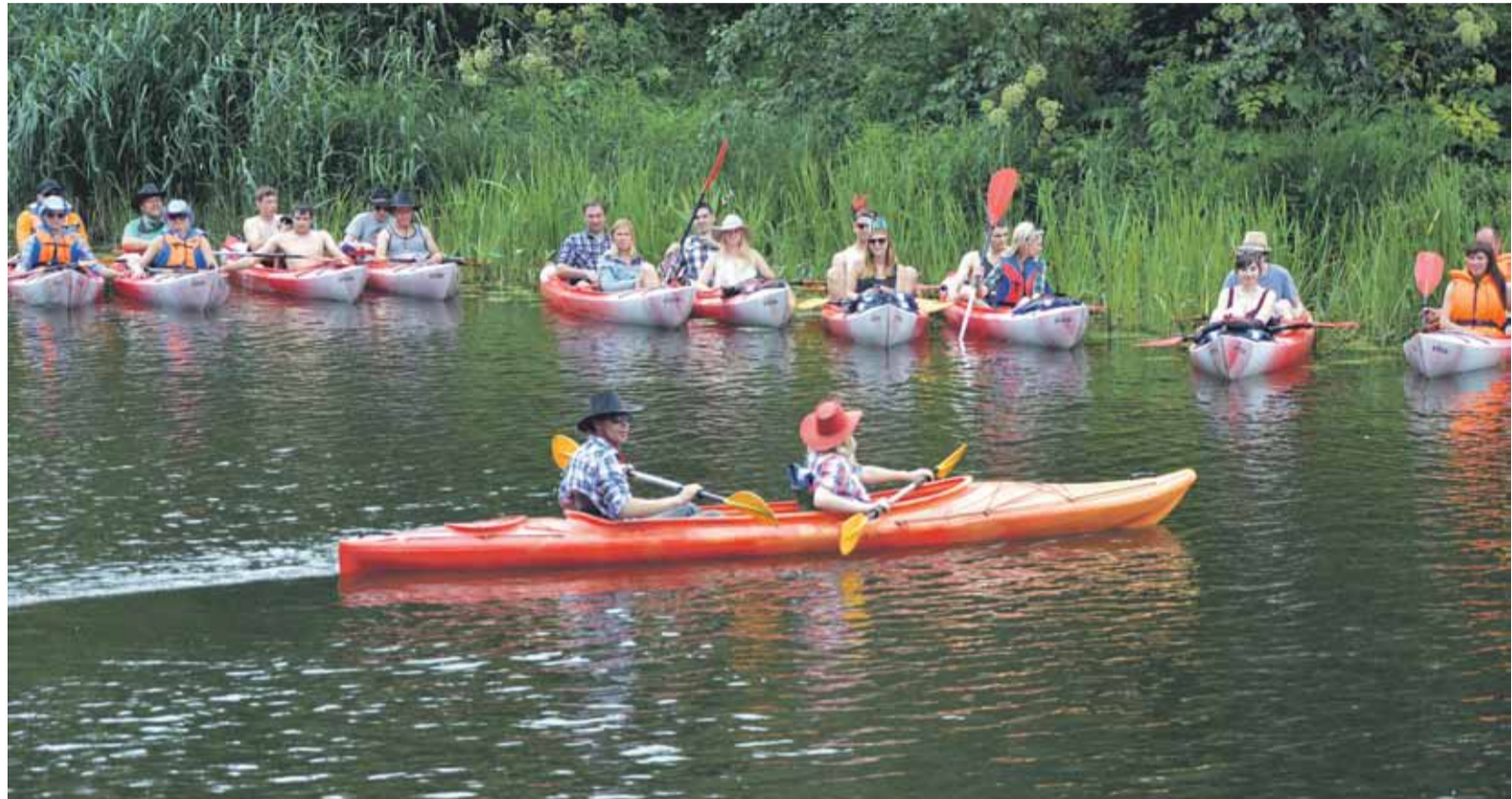
Laivotāji gatavojas startam Abavā virs rumbas.