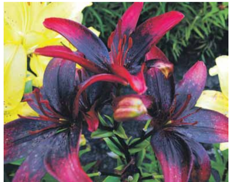
Vistumšākā Inetas dārza lilija – ‘Tango Olina’.