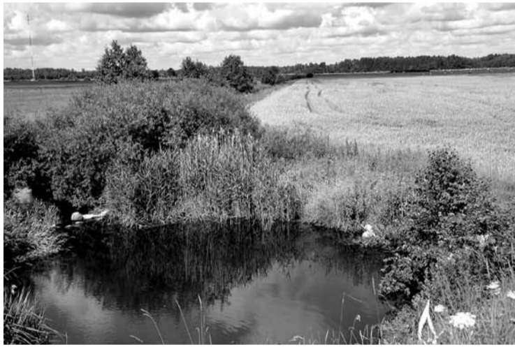
Vieta Vārmes upītē, kurā, visticamāk, lauksaimniecības ķimikāliju ietekmē bojā gājuši aizsargājamie platspīļu vēži.

Pēc Augu aizsardzības dienesta ziņām ziemas kvieši tur migloti ar Moddus 250 EC un fungicīdu Riza 250 e.ū. Abas amatpersonas nenošauc potenciāli atbildīgā zemnieka vārdu, pirms nav saņemti laboratoriskās izmeklēšanas rezultāti. Bet ko no tā būs mācīties citiem