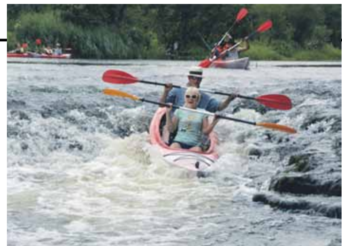
Gan pieredzējušiem ūdenstūristiem, gan iesācējiem jāpārvar lēzenā, bet straujā Abavas rumba.