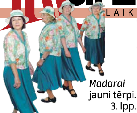
Madarai jauni tērpi. 3. lpp.