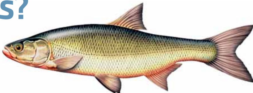
Meža vimba jeb salate ( Aspius aspius )