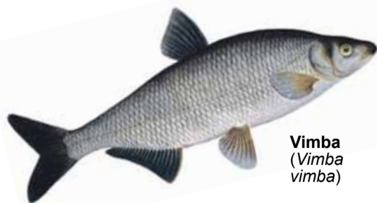
Vimba ( Vimba vimba )