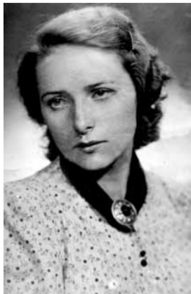
Glīta pirms pirmajām kāzām.

Glītas kundzei ir trīs bērni, netrūkstot arī mazbērnu un mazmazbērnu, bet dzīvē tā iegādājies, ka jaunā paaudze pārsvarā dzīvo Anglijā un atpakaļ braukt negrāsās. Arī meitām un dēlam neesot ne vaļas, ne īstas gribēšanas nākt mammai palīgā. Tagad Glītas kundze dzīvojot viena. Viņa sūrojas, ka neesot vairs spēka apkopt brīvības laikā atdoto zemi pie mājas – viss aizaugot. Tomēr dārzā gan puķes zied, gan zirņi stiepjas garumā, kartupeļi, sīpoli, bietes un sviesta pupiņas jau zemē. Dobs izravētas, tiek stādītas dālijas. Vēl vajagot šabelpupas un gurķītus sasēt. Pagalmā kladzina vistiņas, draiskojas divi kaķi. Vienu brīdi