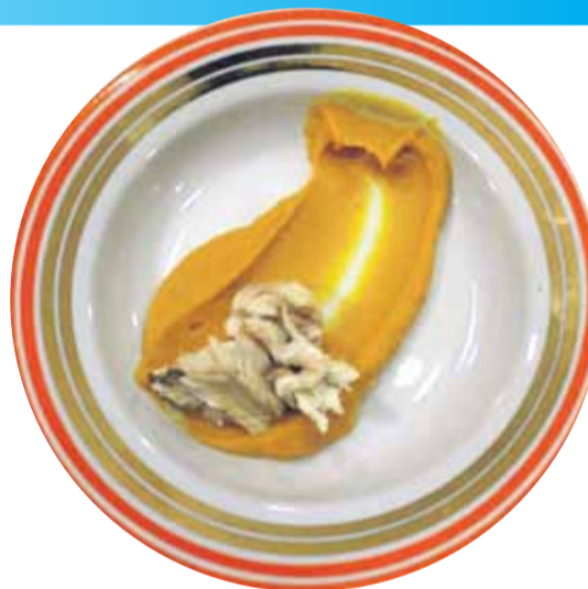
Foreli attīra no asakām un pasniedz ar burkānu biezeni.

Kā pagatavot: foreli iztīra, liek uz cepešplāts un piepilda ar ķiplokiem, citrona šķēlītēm, dillēm un timiāna zariņiem. 1 kg sāls samaisa ar ūdeni (tā, lai masa nebūtu pārāk šķidra) un pārklāj zivij. Cep apmēram 20 minūtes 200 grādos.